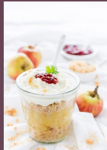
Æblekage – ein traditionelles Dessert aus Dänemark